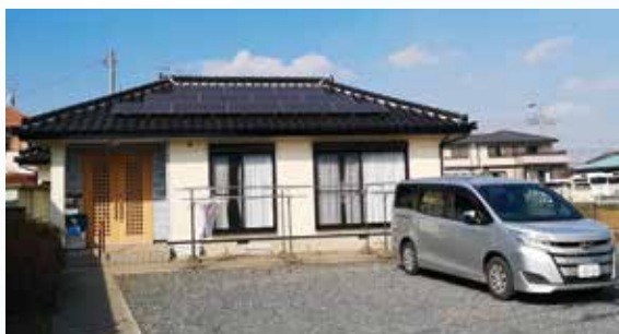
グループホーム ポプラ