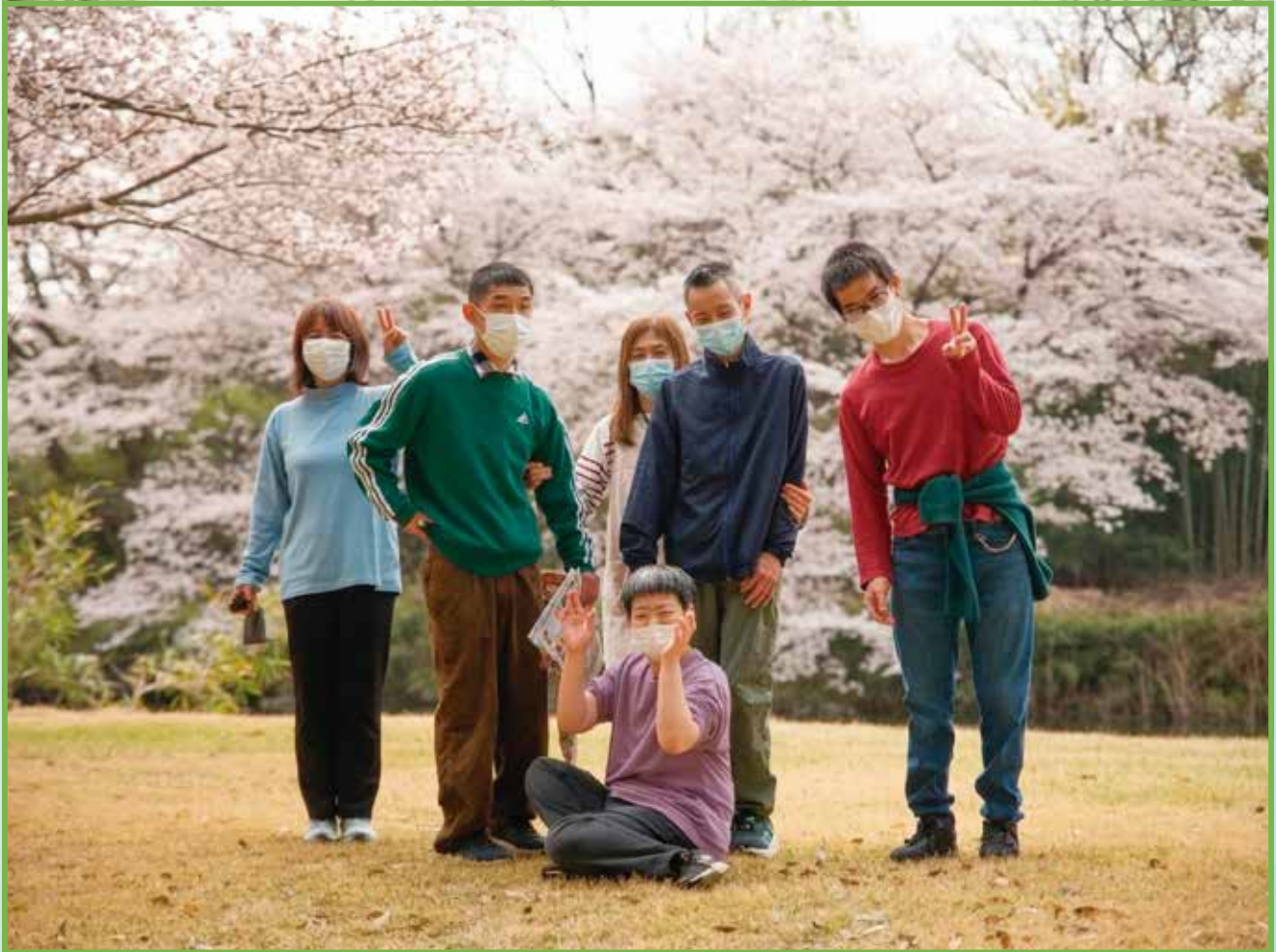
千葉カントリークラブ野田コースにて記念撮影