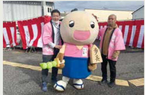
野田市関宿のゆるキャラ「やど助」