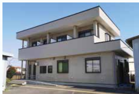
くすのき苑敷地内 自立訓練棟