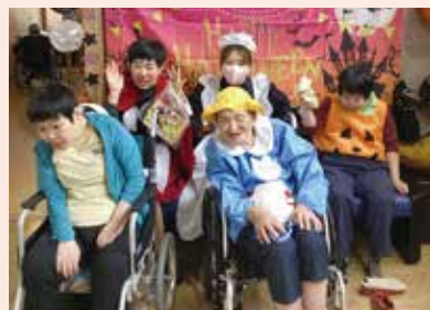
フォトブースにて記念撮影